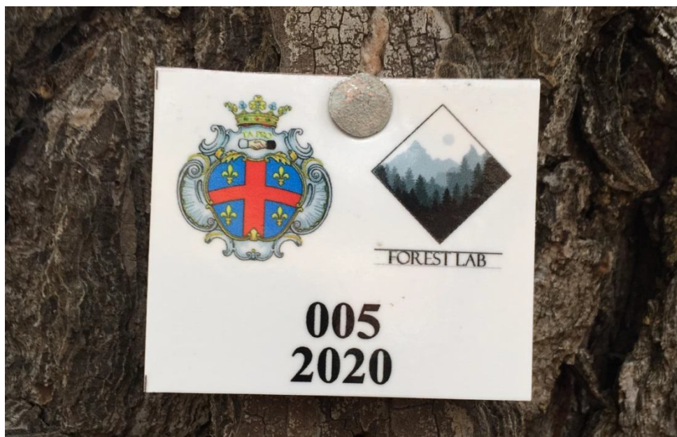
Fig. A: cartellinatura sui soggetti arborei (in alto i loghi istituzionali “Comune di Caiazzo” e “Forest Lab – Ufficio tecnico agro-forestale”; in basso il numero progressivo e l'anno della indagine)

I soggetti arborei sono identificati con un numero progressivo da cartellino apposto in maniera visibile sul tronco (Fig. A).